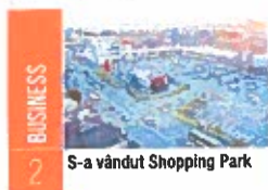
S-a vândut Shopping Park