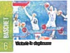
Victorie în deplasare