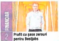
Profit cu șase zerouri pentru Bestjobs