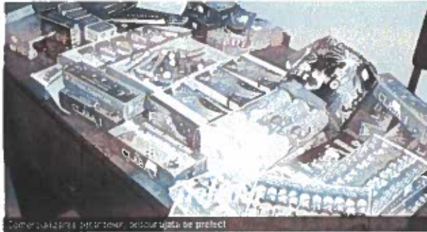
Căminul Prefectural al Județului Mureș, sediul Colegiului Prefectural

„În ultimii ani, nu a existat niciun sezon al sărbătorilor de iarnă în care copii sau tinerii mureșeni să nu ajungă la SMURD cu răni și arsuri cauzate de explozia petardelor. Acesta este unul dintre motivele pentru care am propus Colegiului Prefectural