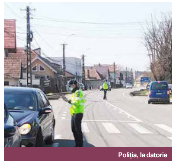
Poliția, la datorie

Biroul de presă al Instituției Prefectului - Județul Mureș a anunțat marți, 21 aprilie, prin intermediul unui comunicat, că în cursul zilei de luni, 20 aprilie, au fost executate peste 170 de misiuni specifice, în contextul prevenirii și combaterii răspândirii Covid-19.